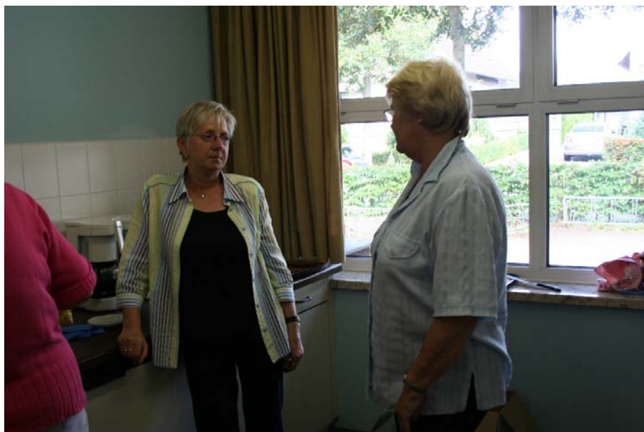
In der Küche gibt es viel zu tun