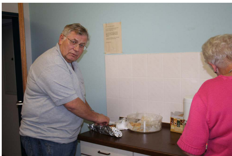
Auch die Herren packen mit an und ein